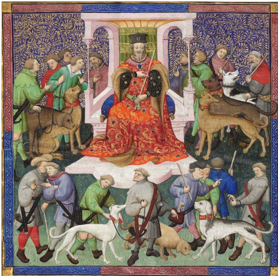
Prologue du Livre de chasse de Gaston Phébus, XVe siècle, BnF, Département des Manuscrits, Français 616, fol. 13r

Bibliothèque Nationale de France, site Richelieu Et en Sorbonne (Amphithéâtre Milne-Edwards)